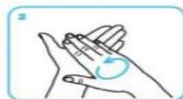
Paume contre paume par mouvement de rotation,