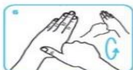
le pouce de la main gauche par rotation dans la paume refermée de la main droite, et vice et versa,