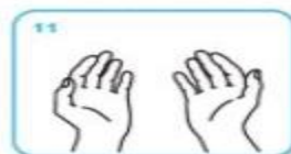
Les mains sont prêtes