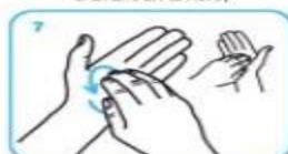
la pulpe des doigts de la main droite par rotation contre la paume de la main gauche, et vice et versa.