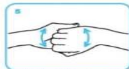
les dos des doigts en les tenant dans la paume des mains opposées avec un mouvement d'aller-retour latéral,