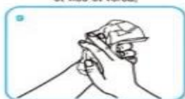
sécher soigneusement les mains avec une serviette à usage unique,