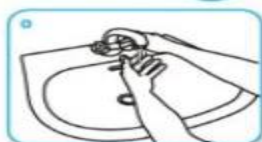
Moutler les mains abondamment