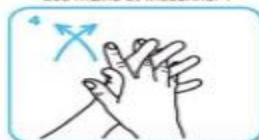
les espaces interdigitaux paume contre paume, doigts entrelacés, en exerçant un mouvement d'avant en arrière,