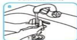
Rincer les mains à l'eau,